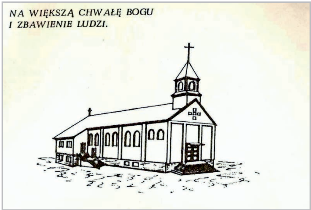
Szkic kościoła w Żurawicy Górnej.