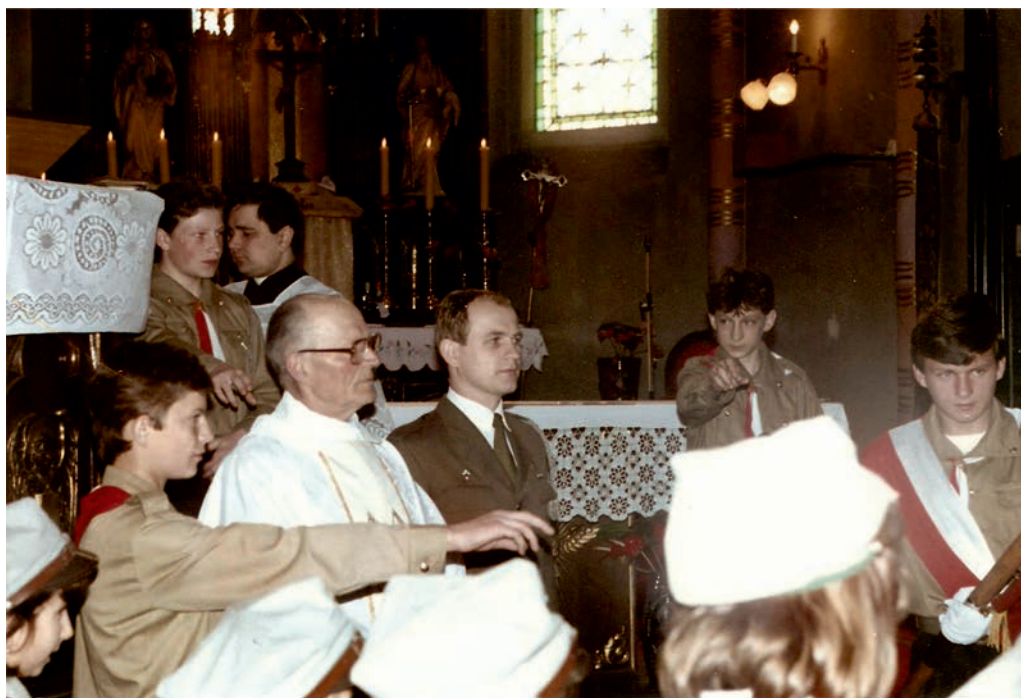
11.05.1991 r. Przyrzeczenie Harcerskie w żurawickim kościele.