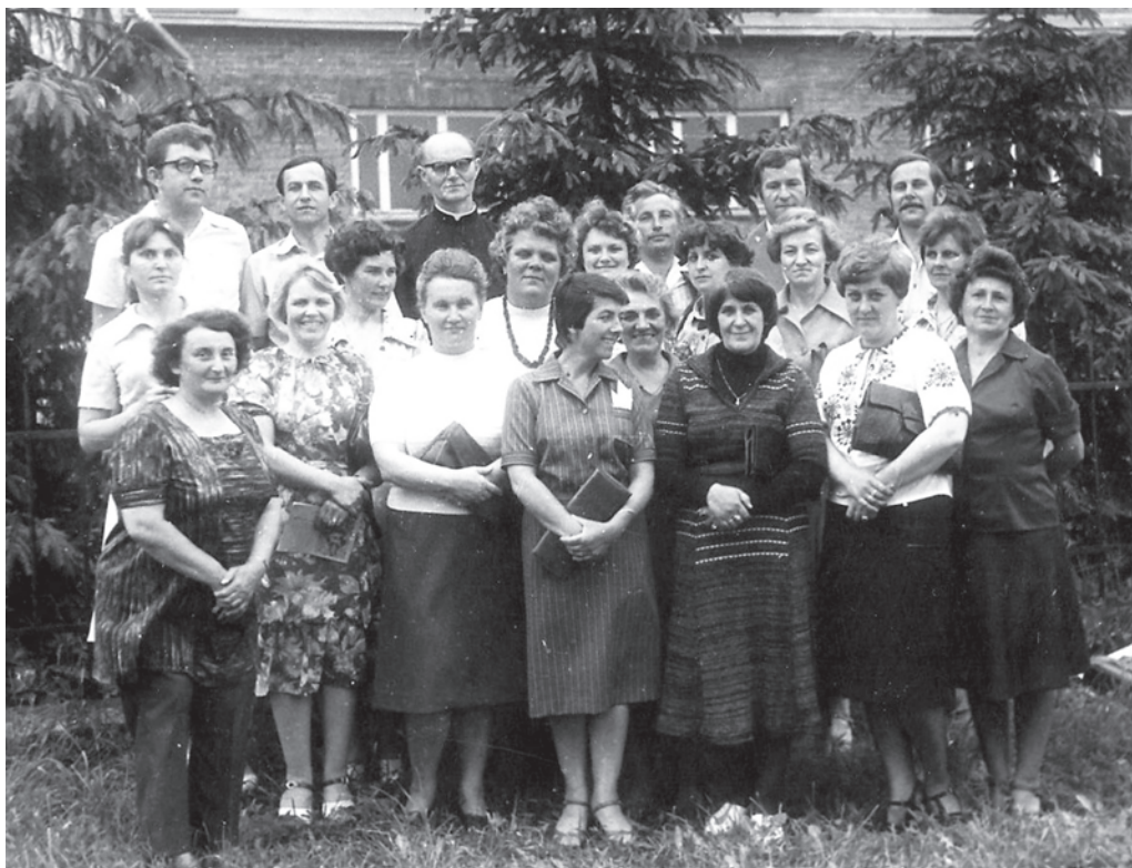
Chór w Żurawicy.