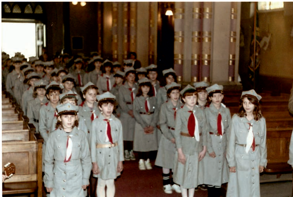
11.05.1991 r. Harcerze i harcerki przed przyrzeczeniem w kościele w Żurawicy.

Zawsze jasno wyrażał poglądy na temat szkoły i oświaty. Był przekonany, że w niedługim czasie religia wróci do szkół. Katecheza dla uczniów Szkoły Podstawowej w Żurawicy w latach 1956 do czerwca 1979 roku odbywała się w prywatnym domu, który znajdował się naprzeciw budynku szkoły podstawowej. Aby nadal zapewnić optymalne warunki do nauczania religii w pobliżu szkoły, Ksiądz Proboszcz wynajął prywatny budynek i dokonał w nim niezbędnych remontów.