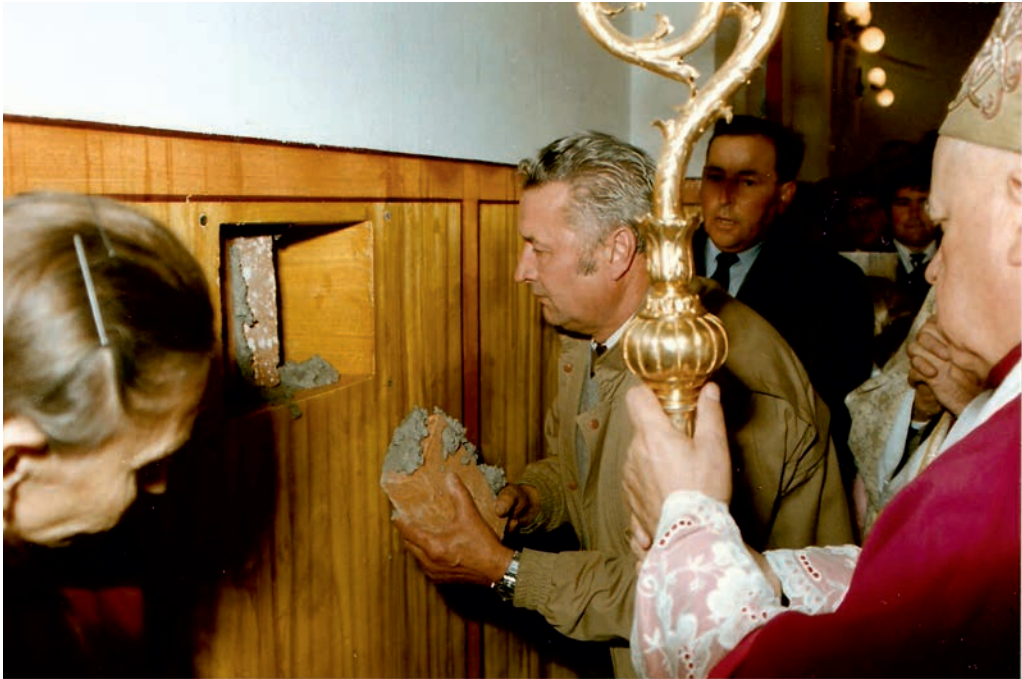
Wmurowanie kamienia węgielnego.

Dekret Arcybiskupa Metropolity Przemyskiego Ignacego Tokarczuka erygujący parafię pw. św. Andrzeja Boboli w Żurawicy Górnej, został ogłoszony w całości dnia 6 sierpnia 1992 roku w święto Przemienienia Pańskiego, przez Księdza Dziekana Stanisława Burczyka, w kościele pw. św. Andrzeja Boboli wobec licznie zgromadzonych parafian. W parafii macierzystej pw. Niepokalanego Poczęcia NMP w Żurawicy wyżej wymieniony dekret został odczytany w niedzielę 9 sierpnia 1992 roku.