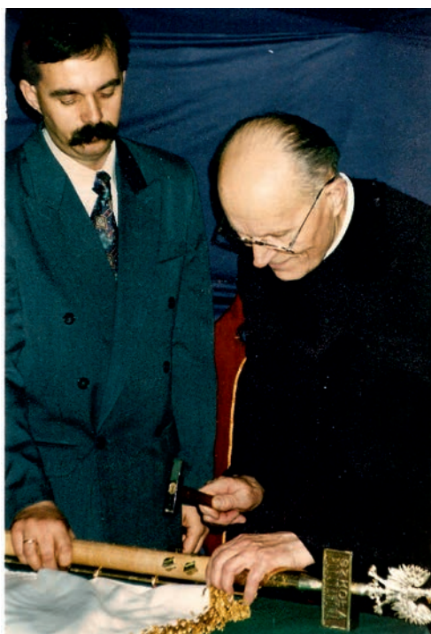
15.11.1997 r. Wbicie pamiątkowych gwoździ.